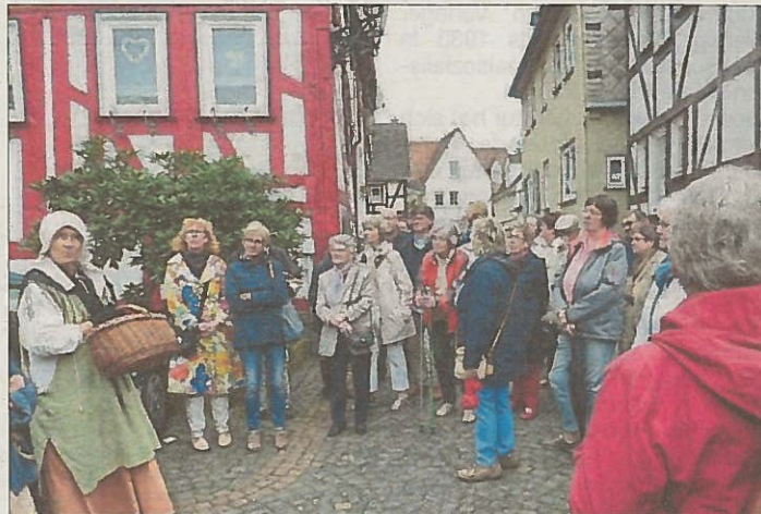
Altstadtführung durch das historische Laubach